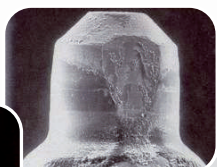
Aspecto de un inyector en contacto con un carburante convencional